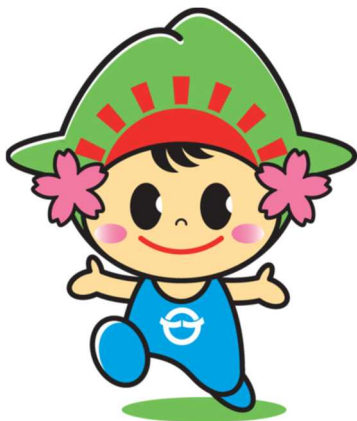
日の出町イメージキャラクター ひのでちゃん

都合により日時・時間等の変更があります。 詳細は広報「ひので」に掲載しております。 ご確認ください。