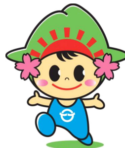
日の出町イメージキャラクター ひのでちゃん

都合により日時・時間等の変更があります。 詳細は広報「日の出」に掲載しております。 ご確認ください。