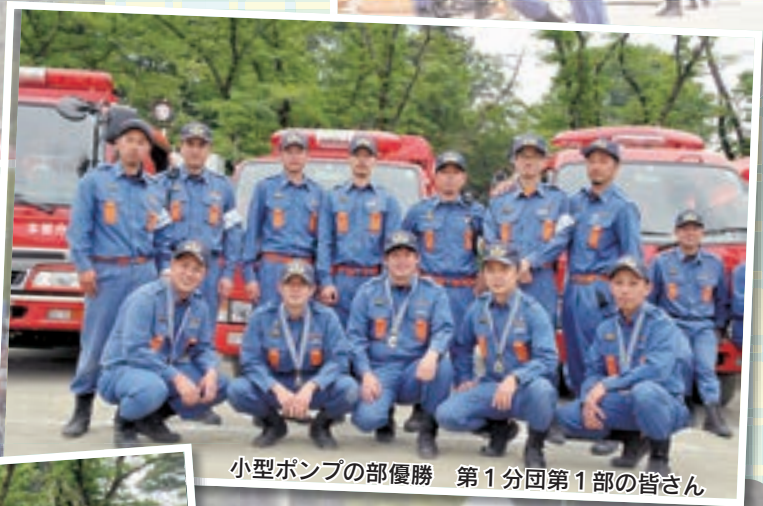
小型ポンプの部優勝 第1分団第1部の皆さん