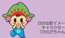
日の出町イメージ キャラクター 「ひのでちゃん」

主催 ひので夏まつり実行委員会 問 ひので夏まつり実行委員会事務局 (企画財政課 企画係 内線 311)