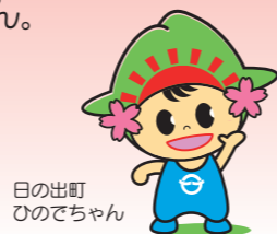
日の出町 ひのでちゃん

申込 企画財政課まで 7月24日(水) 締切 受付は 午前8時30分～午後5時15分 (土日・祝日除く)