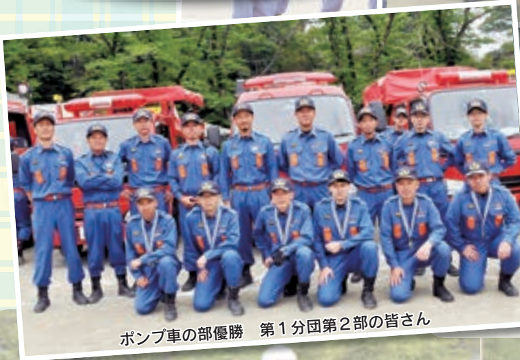
ポンプ車の部優勝 第1分団第2部の皆さん