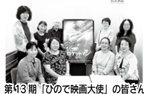
第13期「ひので映画大使」の皆さん

今年度は「天気の子」「ロケットマン」「真実」「空母いぶき」などの作品を鑑賞。新作映画を観て存分に語り合ひましょう!