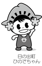
日の出町 ひのでちゃん