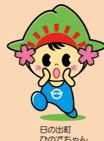
日の出町の ひのでちゃん