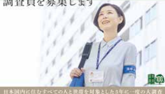
日本国内に住むすべての人と世帯を対象とした5年に一度の大調査