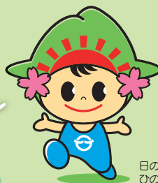
日の出町 ひのでちゃん