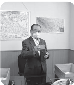
▲日の出町商工会清水会長のくじ引きにより抽選を実施しました。