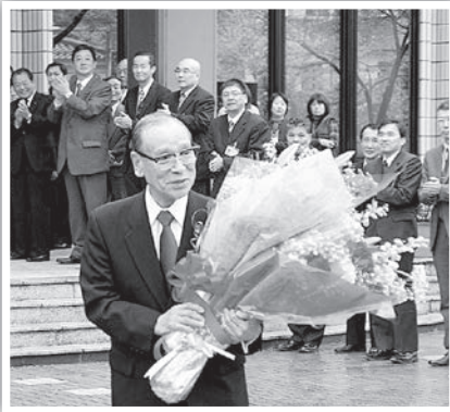
平成22年の退任時の様子