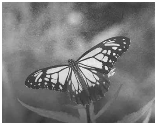
神秘的なアサギマダラ

〔町長〕 A 玉の内ふれあい農園の多目的区画を利用し、フジバカマの植栽など、アサギマダラが飛来する環境整備を検討する。