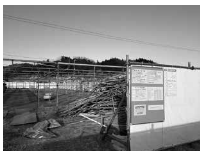
解体が進むトマトハウス

A (課長) 財政支援策は。都の「新規就農者定着支援事業費補助金」を活用し引き続き支援する。