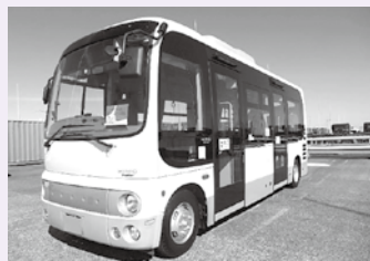
早期の運行が望まれるコミュニティバス（写真はイメージです）

早期のコミュニティバスの運行開始に向け、再度の入札を行い契約を締結することとなりますが、運行開始時期は、運行準備が順調に進んだ場合7月頃を見込んでいます。