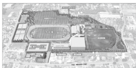
亜細亜大学日の出キャンパス完成図

A (課長) 有料だが、完成後には順次 一般開放・貸出しを行っ ていくと伺っている。