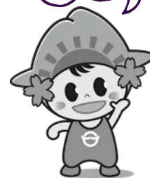
日の出町 「ひのでちゃん」