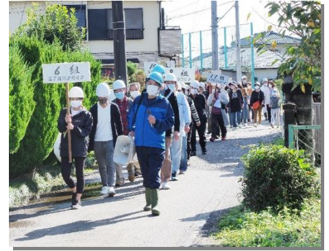
【自主防災組織の防災訓練のようす】

土砂災害ハザードマップ等の作成、町ホームページへの防災情報の掲載等により、防災知識の普及・啓発を図っています。