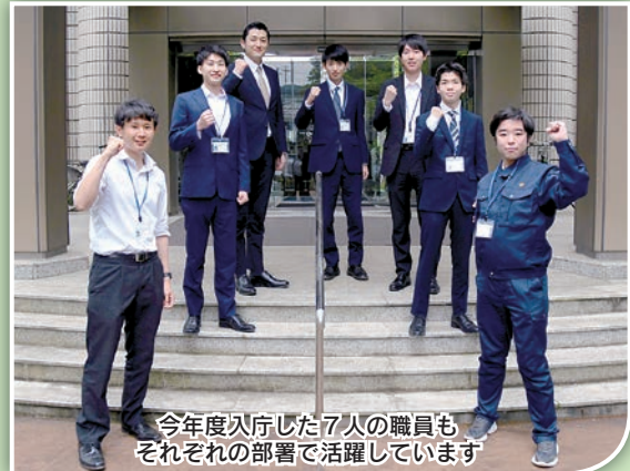
今年度入庁した7人の職員も それぞれの部署で活躍しています