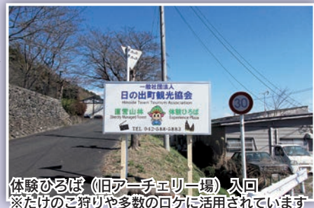
体験ひろば(旧アーチェリー場)入 ※だけのご狩りや多数のロケに活用されています