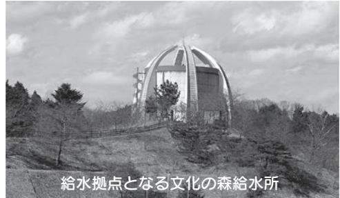
給水拠点となる文化の森給水所