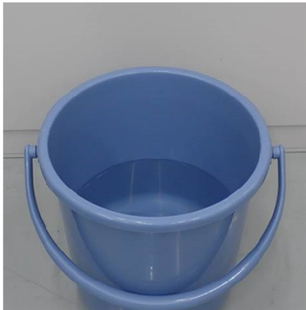
①水を張ったバケツを準備