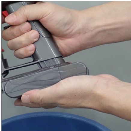
②バッテリーを掃除機に装着