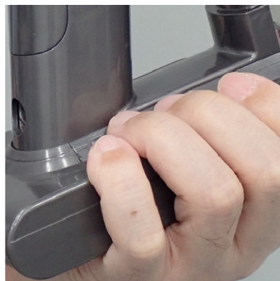
④手のひらをバッテリー底面、指をバッテリー上面にあてがう