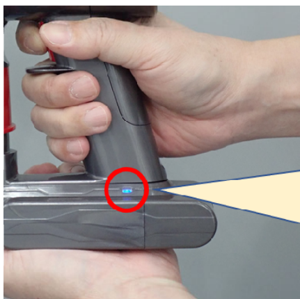
⑤バケツの上で、電池切れになるまで掃除機を運転

運転中、パイロットランプは「点灯」します。電池切れになると、パイロットランプが「点滅」状態になります。