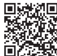
日の出町予約サイト