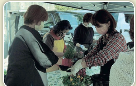
女性部による花いっぱい運動