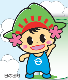
日の出町 ひのでちゃん