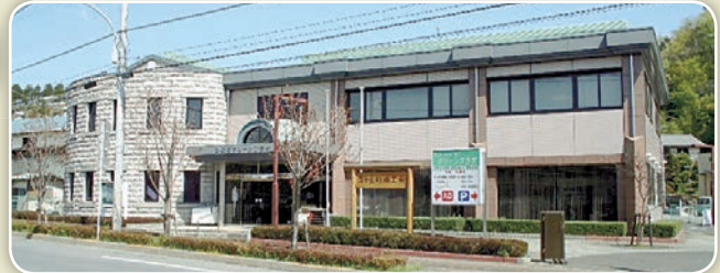
商工会はひのでグリーンプラザの中にあります

また、コロナ渦における消費の停滞を回復させるため、町から補助金による支援を受けて、「町内商店活性化・“ひのでのお店”再発券(第2弾)」事業を行い、世帯主へ抽選で商品券(再・発・券)を発行し、町民の皆様と一緒に落ち込んだ地域経済の再生へ向け、消費喚起の事業なども携わっています。