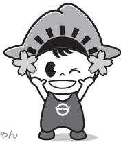
日の出町 ひのぢちゃん