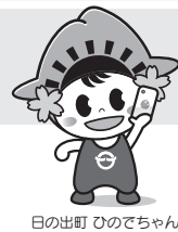
日の出町 ひのでちゃん

税務課 住民税係 ☎042(588)4105 所得税、確定申告に関すること 青梅税務署 ☎0428(22)3185