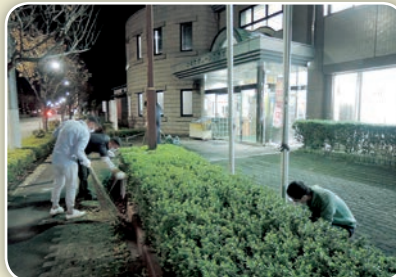
定期的に青年部が清掃活動を実施しています