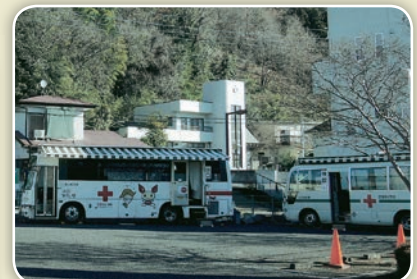
青年部による献血事業