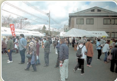
定期的に関催するひので朝市は毎回大盛況です