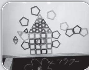
専用のカラーペンやマグネットで遊べるコーナーです。