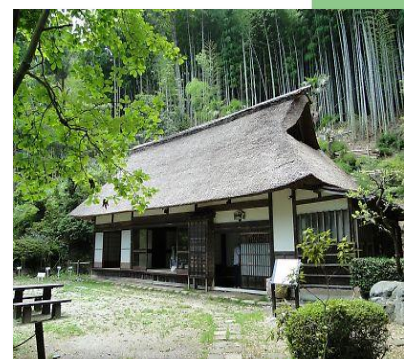
日の出山荘 日の出山荘入口バス停下車 徒歩約 10 分