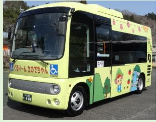
「ぐるり～ん ひのでちゃん」 運行車両