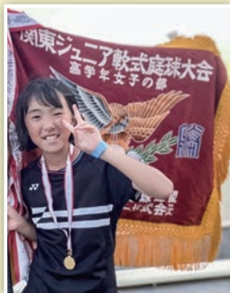
▲関東小学生ソフトテニス選手権大会

令和4年7月2日に行われました「令和4年度 第41回関東小学生ソフトテニス選手権大会」の高学年女子個人戦(ダブルス)で優勝を飾りました。