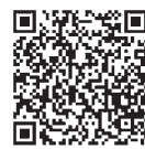
▲利用者登録届 二次元コード