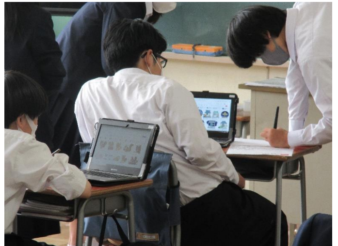
【国語（古典）生徒同士の共有】