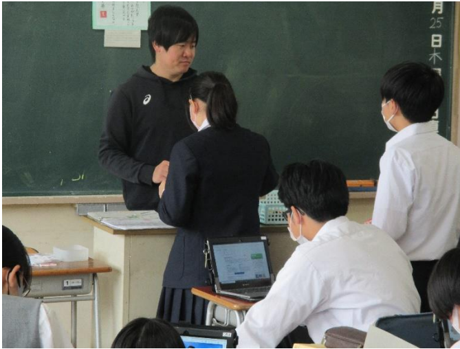
【国語（古典）創作活動】