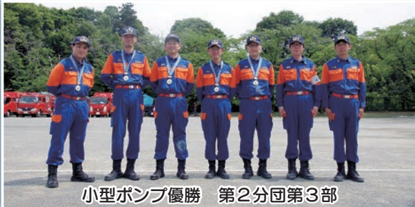
小型ポンプ優勝 第2分団第3部

この素晴らしい、日の出町の 人と自然を災害から守るため、 あなたの力を貸してください!