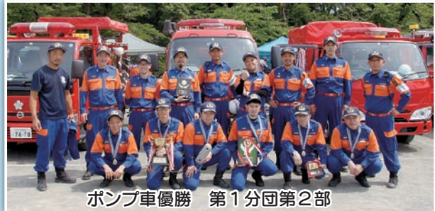
ポンプ車優勝 第1分団第2部