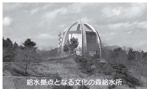
給水拠点となる文化の森給水所