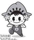
日の出町のちやん

「家庭用可燃ごみ専用収集袋外装袋裏面」 「資源とごみの収集カレンダー」の 掲載広告を募集します