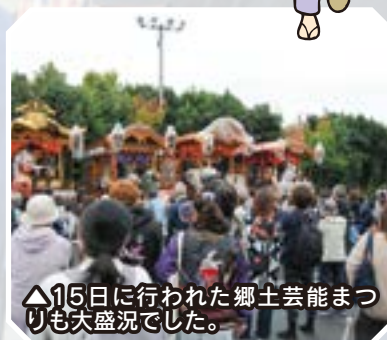
▲15日に行われた郷土芸能まつ りも大盛況でした。

問 日の出町産業まつり実行委員会事務局(産業観光課商工観光係) ☎042(588)4101