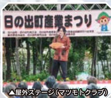
▲屋外ステージ(マツモトクラブ)