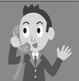
日の出町 ひのでちゃん

特に記載のない場合の受付時間は土・日曜日、祝日、年末年始を除く午前8時30分～午後5時15分(正午～午後1時を除く)です。申込の記載がない場合は直接会場へ。費用の記載が無い場合は無料です。 ひのでA(安全)・A(安心)大作戦