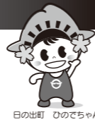
日の出町 ひのでちゃん

・簡易に判断する場合のフローチャートです。不明な点はお問い合わせください。 ・年齢は令和5年12月31日現在です。 ・納めすぎた所得税の還付申告を受ける場合は、下表に関わらず確定申告が必要です。