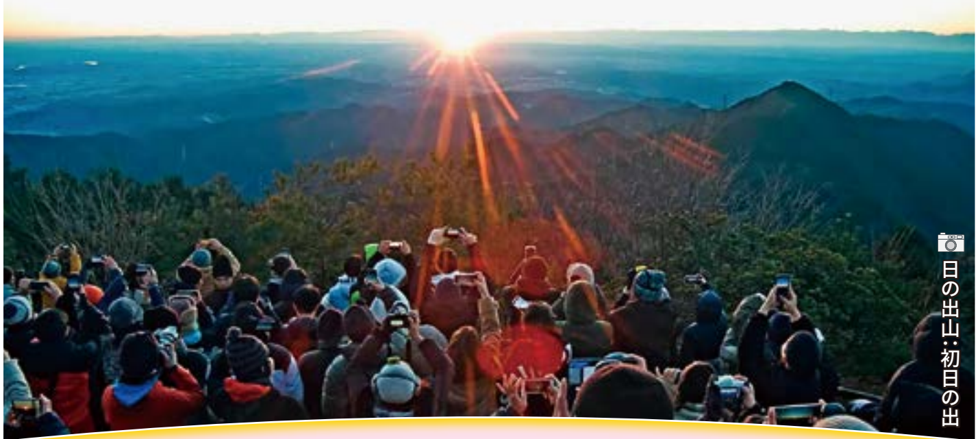
日の出山:初日の出

日の出町の西端、日の出山山頂(標高902m)からの24時間ライブ映像が、パソコンやスマートフォンなどでご覧いただけます。