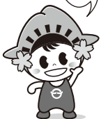
日の出町イメージキャラクター「ひのでちゃん」