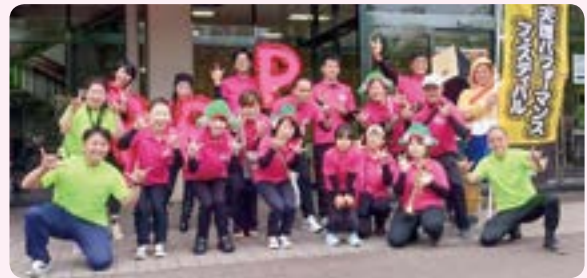
📷 お年寄りリスペクト隊Live in 奈良