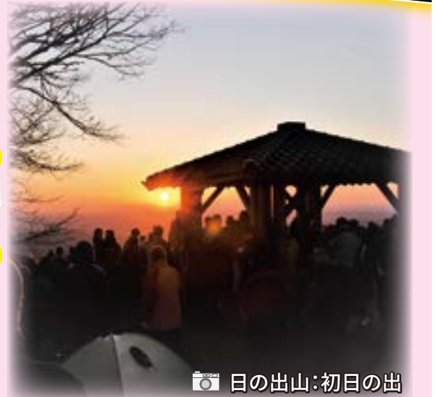
日の出山:初日の出