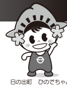
日の出町 ひのでちゃん