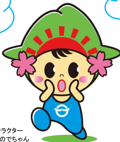
日の出町イメージキャラクター ひのでちゃん