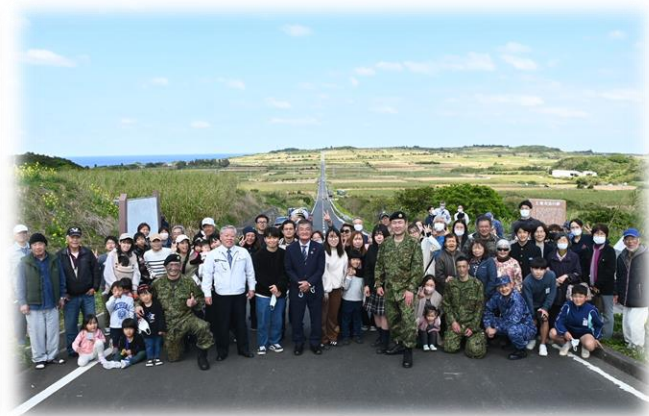
地域交流（集合写真）