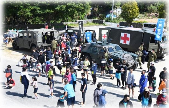
地域貢献活動（装備品展示）