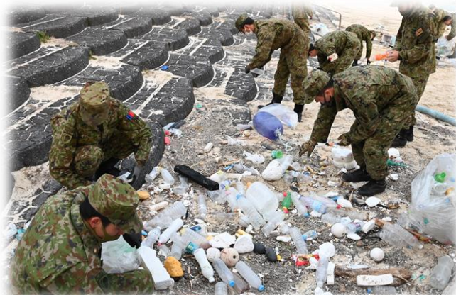
地域貢献活動（海岸清掃）