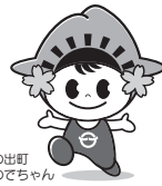
日の出町のてんちゃん