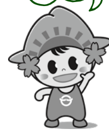
日の出町 「ひのでちゃん」