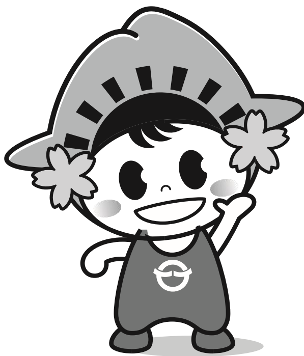
日の出町「ひのでちゃん」