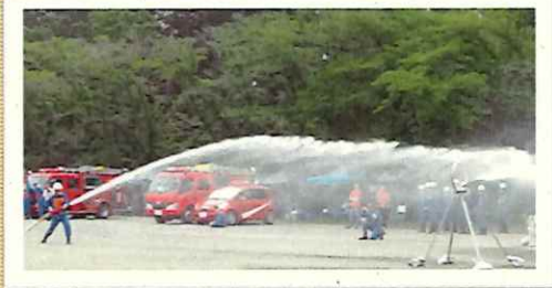
写真：第27回大会(令和元年)

3月より町内各地で操法大会に向けた訓練が始まります。訓練会場の近隣の皆様には御迷惑をお掛けしますが、ご理解・ご協力をお願いいたします。